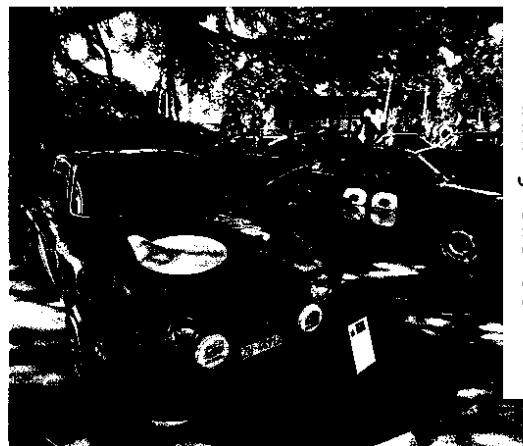
Sportgeräte | Alfa, Zagato, Ferrari

Dazu trägt auch bei, dass es kein Concours d'Élégance im klassischen Sinne ist, also nur ein Treffen der schönsten Karosserien, sondern ein Treffen klassischer Fahrzeuge, bei denen auch ein durchaus seltener Seat 600 seinen Platz und seine Anerkennung verdient. Die Vielfalt war entspre-