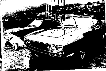
Monteverdi 375 L, Highspeed, 1975.