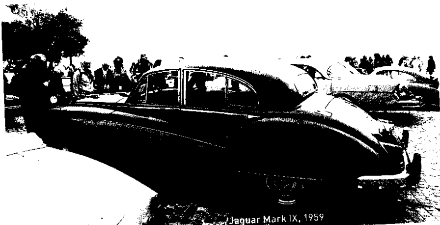
Jaguar Mark IX, 1959

A scona gilt als die Sonnenstube der Schweiz – doch für die diesjährige Durchführung des ACCA traf dies nicht zu. Da für den Samstag, 24. September 2022, regnerisches Wetter angesagt war, konnte der Wettbewerb nicht wie geplant auf dem Rasen der noblen Parkanlage des Hotels Castello del Sole in Szene gesetzt werden. Doch immerhin versprach die Wetterprognose für den Sonntag, 25. September, trockenes Wetter – ideal, um den beliebten Classic Award in konzentrierter Form am Lungolago durchzuführen. Trotz unsicherem Wetter fanden sich vierzig sehenswerte Oldtimer aus allen Regionen der Schweiz ein, zudem ein edler Ferrari 250 GT Lusso aus Italien. Ein