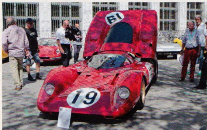
Der Preis «Best of Show» ging an den Ferrari 312 P , ein Rennwagen mit eindrücklichem Sound.

Fahrzeug: Jaguar XK 140. «Ich habe das Fahrzeug 2012 gekauft, es ist frisch restauriert und ich fahre es praktisch täglich und starte morgen nach Paris.»